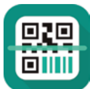
Lector de código QR en español