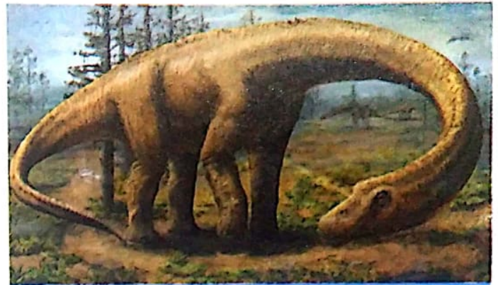
Reconstrucción artística del Dreadnoughtus schrani .

"Los restos fósiles fueron separados de rocas en los Estados Unidos y fueron analizados. También