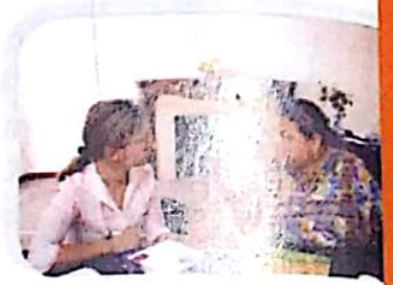
Rigoberta Menchú (1959, Guatemala), Premio Nobel de la Paz, fue entrevistada en reiteradas oportunidades por su incansable labor como defensora de los Derechos Humanos.

La entrevista es una conversación entre dos interlocutores, un entrevistador y un entrevistado, sobre un tema de interés público y con un objetivo particular conocido por ambas partes. Se suele entrevistar a personas que se destacan en alguna esfera de la vida, como el arte, la ciencia, los espectáculos, para que brinde información sobre su disciplina y opine acerca de ella. Existen diferentes tipos de entrevistas. En las radiales y las televisivas , el público escucha la voz del entrevistado, su tono, o bien ve sus expresiones y sus gestos. Las entrevistas gráficas , en cambio, se transcriben para ser publicadas.